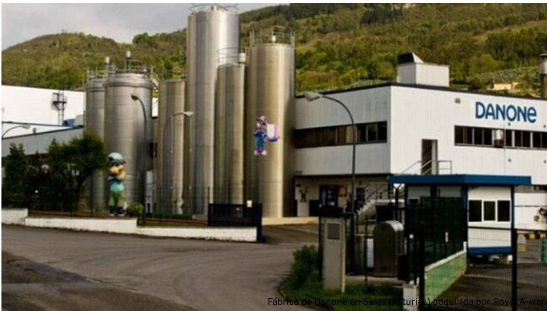
Fábrica de Danone en Salas (Asturias) adquirida por Royal A-ware

La compañía, que ha adquirido la fábrica de Danone en Salas, iniciará un proceso de rehabilitación de la planta que durará año y medio. La mozzarella se elaborará con leche de la zona.